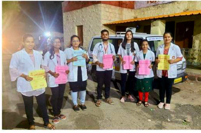
८)दि.10/06/2022साई आयुर्वेद मेडिकल कॉलेज अँड रिसर्च सेंटर सासुरे,वैराग Camp at सावंतवाडी,वाणेवाडी NSS Unit Members 10 यातर्फे आज हे शिबिर राबविण्यात आले.