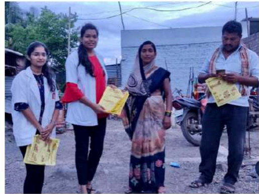
१०)दि.12/06/2022साई आयुर्वेद मेडिकल कॉलेज अँड रिसर्च सेंटर सासुरे,वैराग Camp at गावडी दारफळ,धामनगाव NSS Unit Members ८यातर्फे आज हे शिबिर राबविण्यात आले.