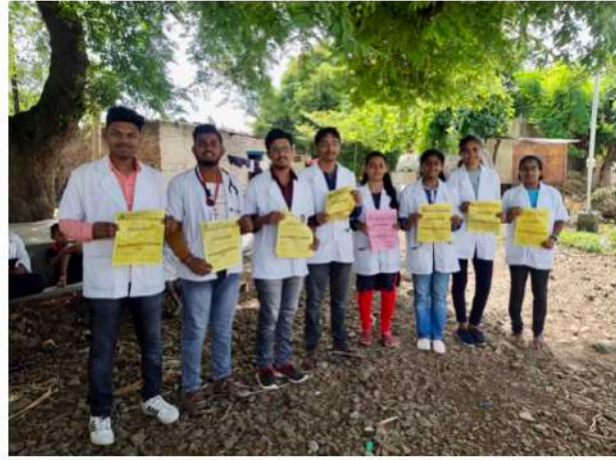
९)दि.11/06/2022साई आयुर्वेद मेडिकल कॉलेज अँड रिसर्च सेंटर सासुरे,वैराग Camp at जवळगाव ,सारोळे NSS Unit Members 10 यातर्फे आज हे शिबिर राबविण्यात आले.